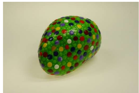
Pippi Langstrumpf (Astrid Lindgren)