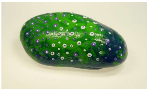
Der Froschkönig (Brüder Grimm)

Oder der REGENBOGEN, der mit einem Lied die Herzen berührt?