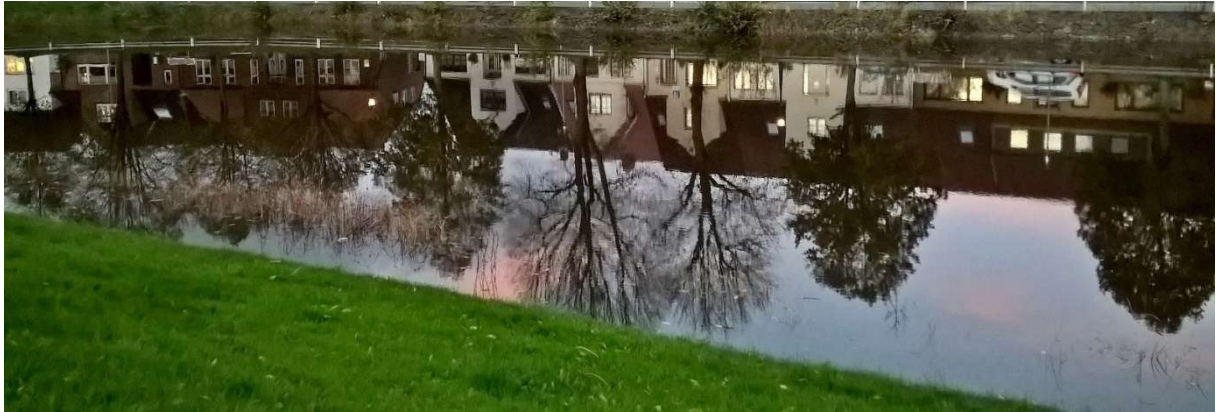
Häuserreihe am Hafen auf den Kopf gestellt.