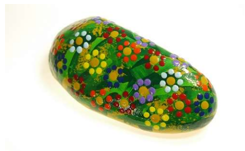
Alice im Wunderland (Lewis Carroll)