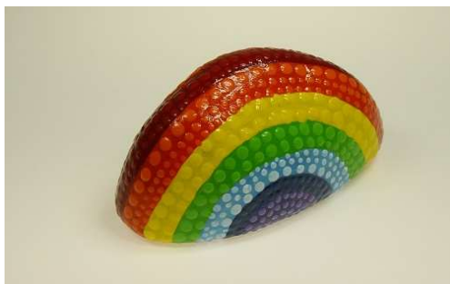
Regenbogen („Over The Rainbow“, Israel „IZ“ Kamakawiwo'ole)