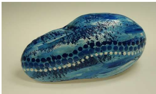
Urmel taucht ins Meer (Augsburger Puppenkiste)